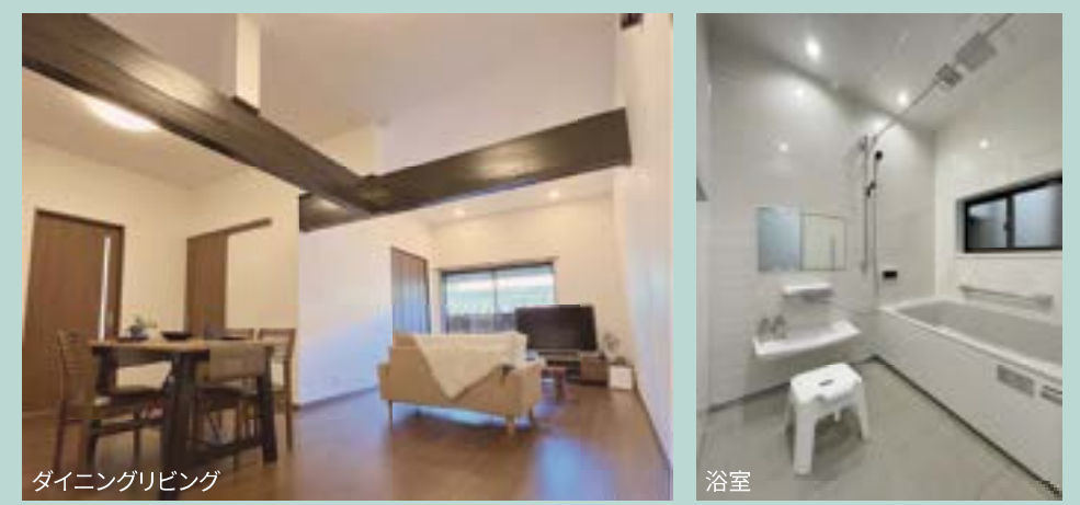
ダイニングリビング