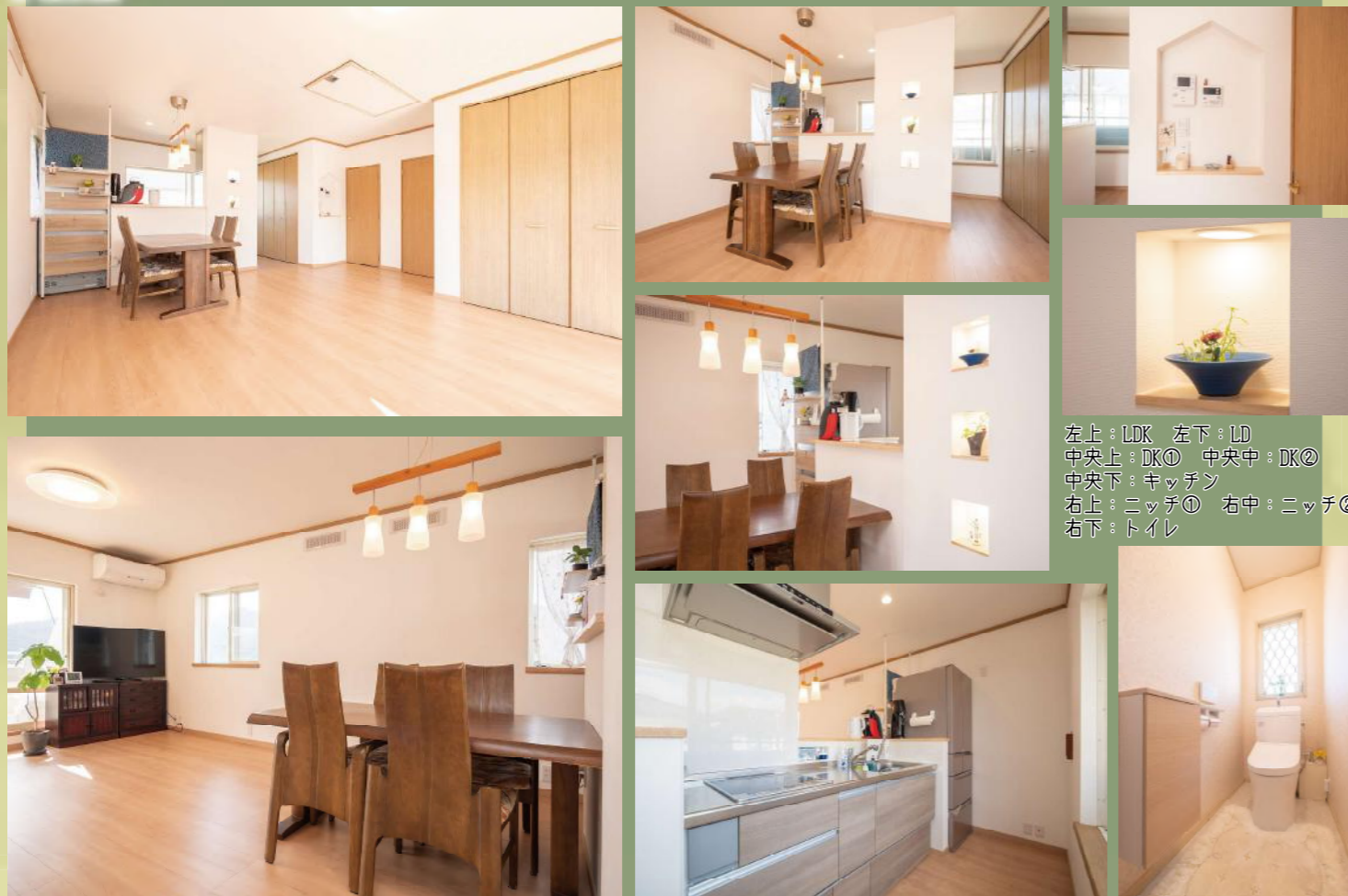
左上：LDK 左下：LD 中央上：DK① 中央中：DK② 中央下：キッチン 右上：ニッチ① 右中：ニッチ② 右下：トイレ