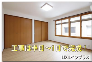
工事は半日〜1日で完成! LIXILインプラス

暑い夏の日差しを遮熱するには、遮熱高断熱Low-E複層ガラスを入れた内窓「インプラス」が効果を発揮します。今ある窓の内側に取り付けるだけで、簡単に施工が完了します。