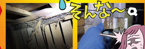
大引きが食害にあっていました! 給水管の保温材内部に道が!