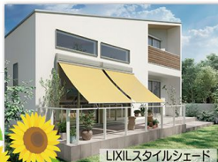
LIXILスタイルシェード

強い日差しをコントロールできるシェード。窓の外側で紫外線や太陽の熱を遮るので室温の上昇を抑え冷房費の削減になります。南側の窓は冬は暖かい日差しを採りこみ、夏は「シェード」やひさしで対策がおすすめです。室内への紫外線を抑えるので家具や床、壁の日焼けを軽減します。