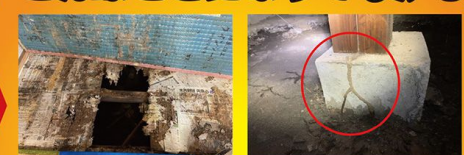
畳をめくったら床板が食害にあっていました! 地中の巣から道(トンネル)を作り床下の木材を食べます。