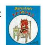
あかたろうの123の345 北山葉子