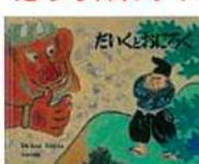
だいきり 松井 正