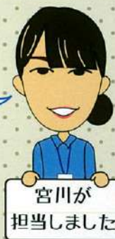
宮川が担当しました