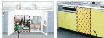
ここに設置できます。

片付けの時間が短縮することで食後に時間のゆとりが生まれるのも大きなメリットです。 ビルトイン食洗機は、食洗機についていないキッチンにも設置する事ができます。(図参照)