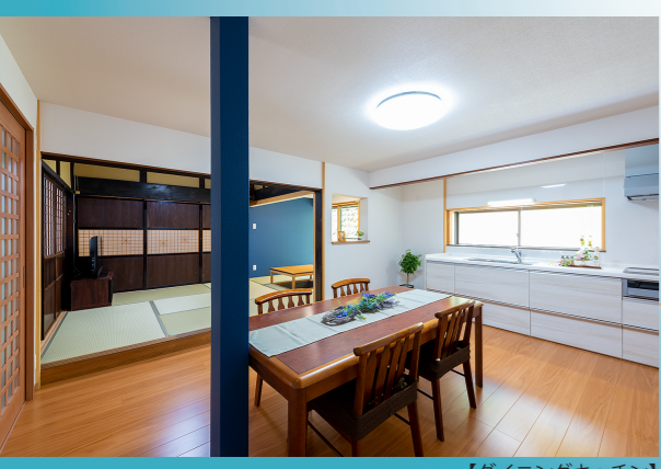
【ダイニングキッチン】