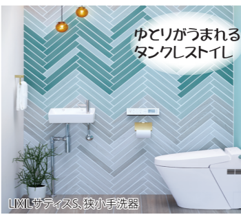
ゆとりがうまれるタンクレストイレ

タンクレストイレなら、タンクがない分トイレを広く使えます。便器をタンクレスに変えると、水をためておく大きなタンクがない分奥行きが10cmほど小さくなります。