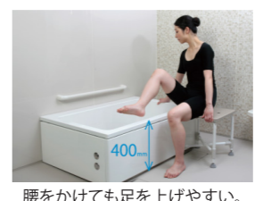
腰をかけても足を上げやすい。