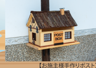
【お施主様手作りポスト】