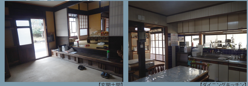
【玄関土間】 【ダイニングキッチン】