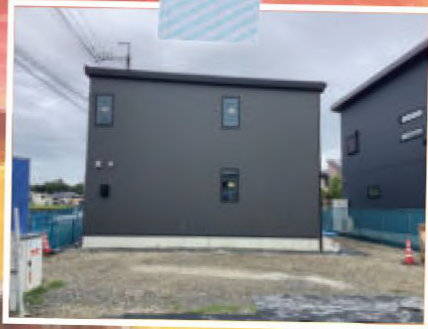
モデルハウス(丹波篠山市)