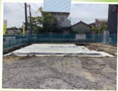
モデルハウス(丹波篠山市)