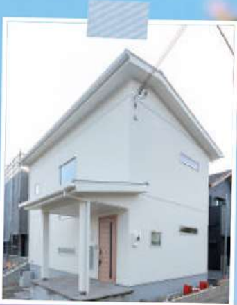
福知山新モデルハウス(福知山市)