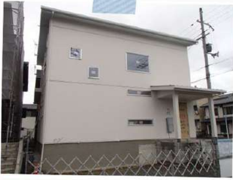
福知山新モデルハウス(福知山市)