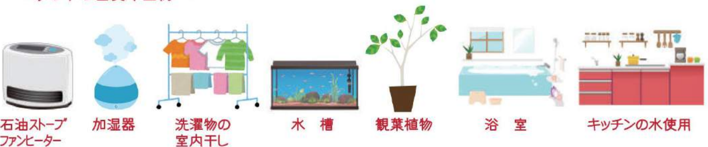
石油ストーブ ファンヒーター