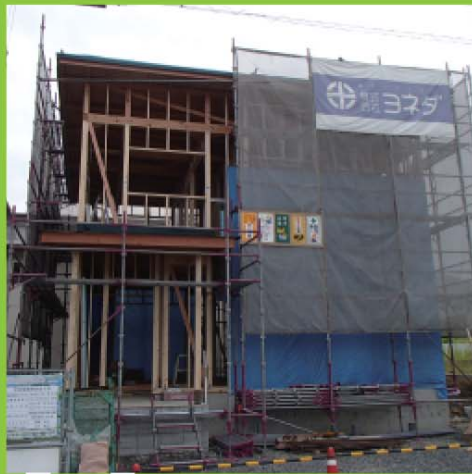
H 様邸 福知山市