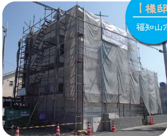
I 様邸 福知山市