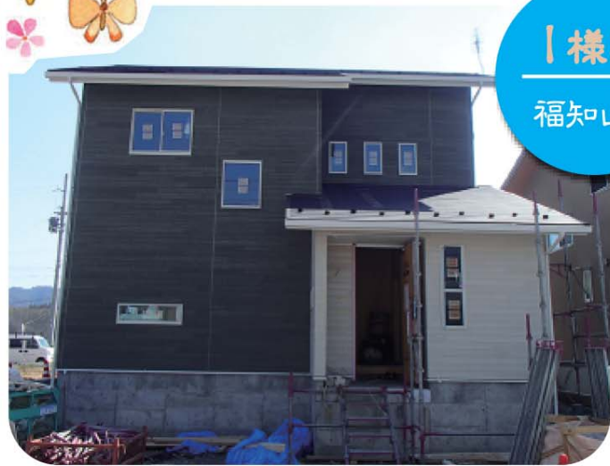
I 様邸 福知山市