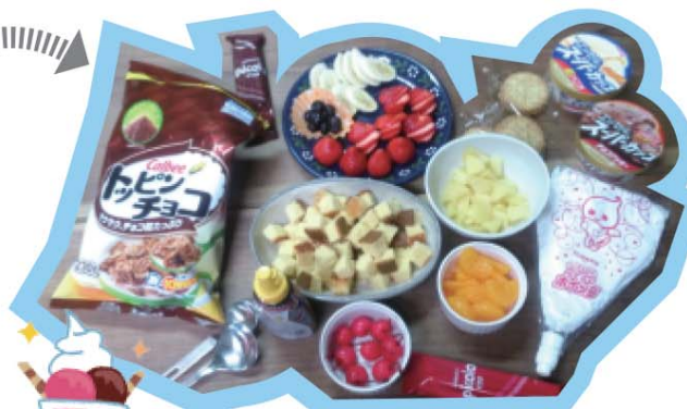
↑ 設計図に基づき 本材料準備