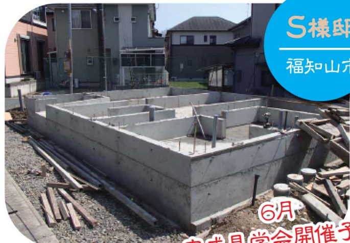
S 様邸 福知山市