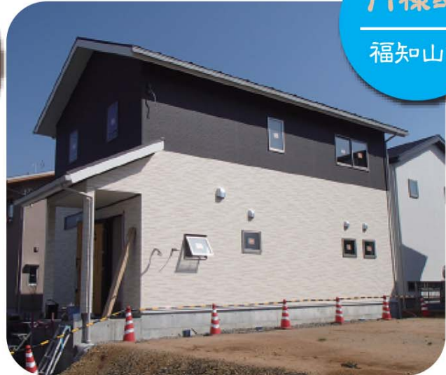
II 様邸 福知山市