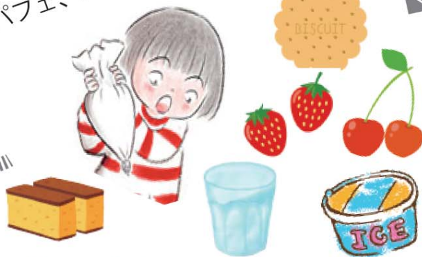
↑ 好きな容器に自由にレイアウト！