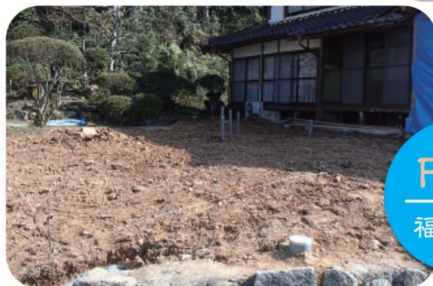
F 様邸 福知山市