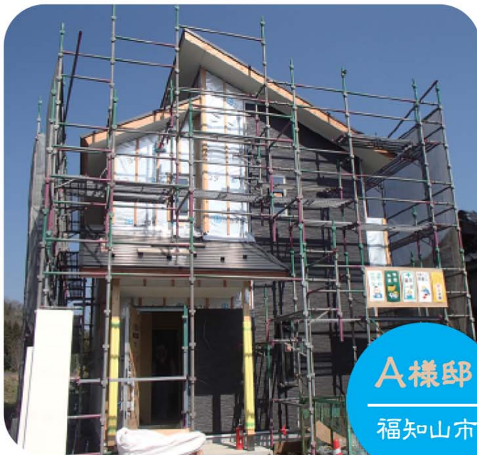
A 様邸 福知山市