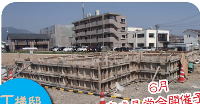
T 様邸 福知山市