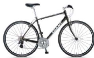
おすすめクロスバイク Giant(ジャイアント)「Escape R3」 約5万円程

ミニベロ(小型自転車)や折りたたみ自転車もオシャレですが、タイヤが小さいので、通勤にはオススメできません。またロードバイク(高速走行を目的に設計された自転車)は価格のかなり高くなってしまっているので、初心者の方にオススメの通勤用自転車は、タイヤの細いクロスバイクか、タイヤの太いマウンテンバイクのどちらかです。中でもクロスバイク(クロスとはマウンテンバイク×ロードバイクという意味)は、重いママチャリ、パンクしやすいロードバイク、タイヤの転がり抵抗の大きいマウンテンバイク、それぞれの欠点を克服し、街乗り用に最適化された万能バイクと言えます。自転車に乗りながらスポーツカーを運転するような加速とシフトアップの感覚が味わえて毎日の通勤が楽しくなりますよ！