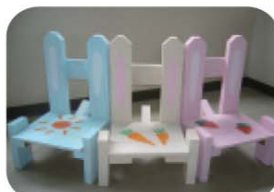
『どうぞのイス』を作ろう!