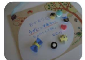
『コミュニケーションボード』を作ろう!