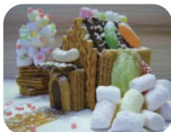
『お菓子の家』を作ろう!