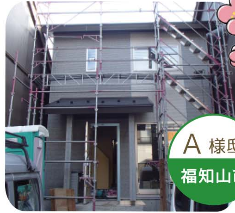
A 様邸 福知山市