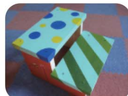
『おてつ台』を作ろう!