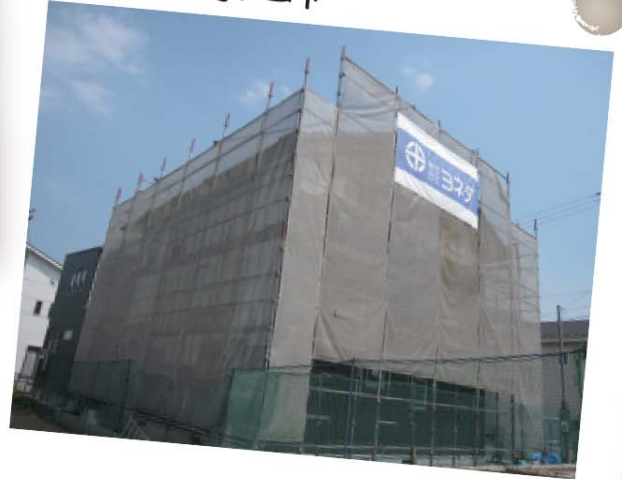
工棟邸 / 福知山市