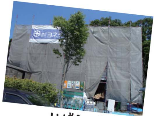
L様邸 / 系野町