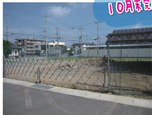
F様邸 / 福山市