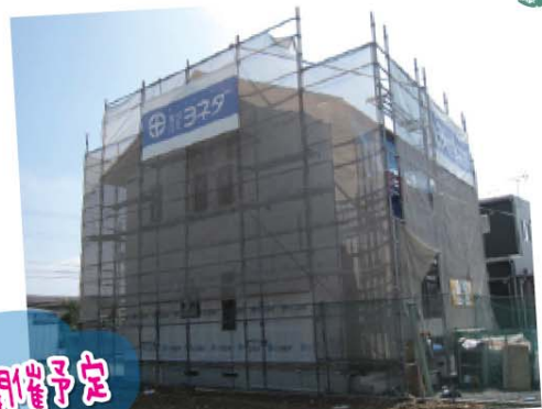
I様邸 / 福山市