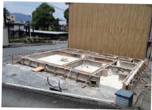
J様邸 / 福山市