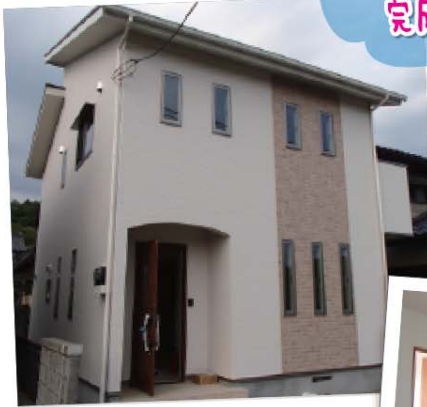
K様邸 / 福山市